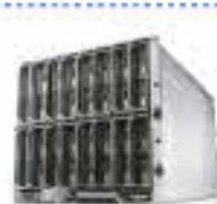
Dell PowerEdge R720