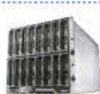
Dell PowerEdge R720 Dell PowerEdge R620 Dell PowerEdge T620 Dell PowerEdge M620